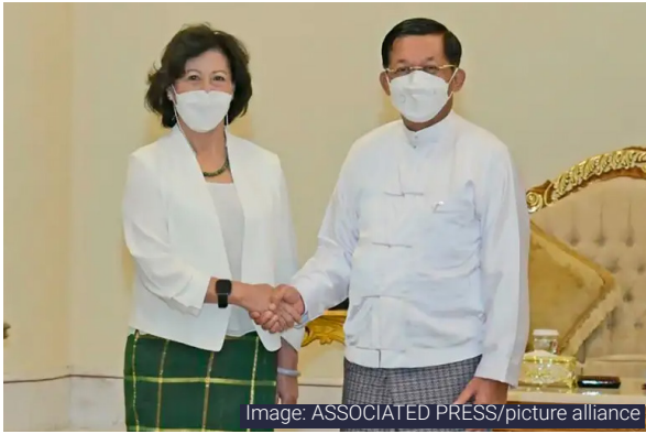
ကုလသမဂ္ဂ၏ မြန်မာနိုင်ငံဆိုင်ရာ ယခင် အထူးသံတမန် Noeleen Heyzer အား စစ်အုပ်စု၏ ခေါင်းဆောင် ဗိုလ်ချုပ်မှူးကြီး မင်းအောင်လှိုင် နှင့် အတူ ၂၀၂၂ ခုနှစ် ဩဂုတ်လတွင် တွေ့ရစဉ်။

အထူးကိုယ်စားလှယ်သည် နှုတ်ထွက်ခြင်းမပြုမီ ပဋိပက္ခများကို ဖြေရှင်းဆောင်ရွက်ရာတွင် ဒေသတွင်း စည်းလုံးညီညွတ်မှု ပိုမို မြင့်တက်လာရန်အတွက် ဘေဂျင်း နှင့် နယူးဒေလီကို တရားဝင်သွားရောက် လည်ပတ်ခဲ့ပြီး အားလုံးပါဝင်နိုင်သော လူသားချင်း စာနာမှုဆိုင်ရာ ဆွေးနွေးပွဲ (IHF) အား ကျင်းပရန် တောင်းဆိုခဲ့သည်။ ၁၉၉ ပကတိအမှန်တရားများကို ကျယ်ကျယ်ပြန့်ပြန့် စိစစ် အကဲဖြတ်ရန် ကြိုးပမ်းရာတွင် အားလုံးပါဝင်ရန်နှင့် လိုအပ်နေသူများထံသို့ ပိုမိုထိရောက်စွာ ပံ့ပိုးပေးအပ်နိုင်ရန် လူသားချင်း စာနာမှု ဆိုင်ရာ လှုပ်ရှားဆောင်ရွက်သူများအတွက် အတားအဆီးများကို ကျော်လွှားနိုင်မည့် နည်းလမ်းများကို ရှာဖွေဖော်ထုတ် ရန်အတွက် အထူးသဖြင့် မြန်မာနိုင်ငံ၏ အိမ်နီးချင်းနိုင်ငံများနှင့် အခြားဒေသတွင်း နိုင်ငံများ ပါဝင်သည့် ကုလသမဂ္ဂအဖွဲ့ဝင် နိုင်ငံများ၏ အဓိကအဖွဲ့အနေဖြင့် ၂၀၂၃ ခုနှစ်၊ မတ်လ၌ ကျင်းပသော အထွေထွေညီလာခံတွင် ပူးပေါင်းပါဝင်နိုင်သည်ဟု အထူး ကိုယ်စားလှယ်က မှတ်ချက်ပြုခဲ့သည်။ ၂၀၀ IHF နှင့်ပတ်သက်၍ သူမ၏ဆွေးနွေးမှုသည် ပြည်တွင်း တက်ကြွလှုပ်ရှားသူများအကြား အပြုသဘောဆောင်သော ဆွေးနွေးပွဲများ ကျင်းပခြင်းနှင့် ပိုမိုစည်းလုံးညီညွတ်မှုနှင့် ကျိုးကြောင်း ဆီလျော်မှု တည်ဆောက်ခြင်း ဆောင်ရွက်ရာတွင် အရေးပါသော နည်းလမ်းတစ်ခုဖြစ်ကြောင်း ယနေ့ထက်ထိ သက်သေပြနေသည်ဟု သူမက ထပ်လောင်းပြော ကြားခဲ့သည်။ ၂၀၁ သို့သော် ထိုကမကထပြု ဆောင်ရွက်ချက်သည် ကန့်ကွက်မှုများနှင့် ရင်ဆိုင်ခဲ့ရသည်။ အထူးကိုယ်စားလှယ်၏ နောက်ဆက်တွဲ ရာထူးမှနှုတ်ထွက်မှုသည် မြန်မာနိုင်ငံနှင့် ပတ်သက်လျှင် ကုလသမဂ္ဂတွင် ပြည့်စုံ လွှမ်းခြုံမှုရှိပြီး တစ်သမတ်ထဲ ဖြစ်သော မဟာဗျူဟာမရှိကြောင်း မီးမောင်းထိုးပြနေသည်။